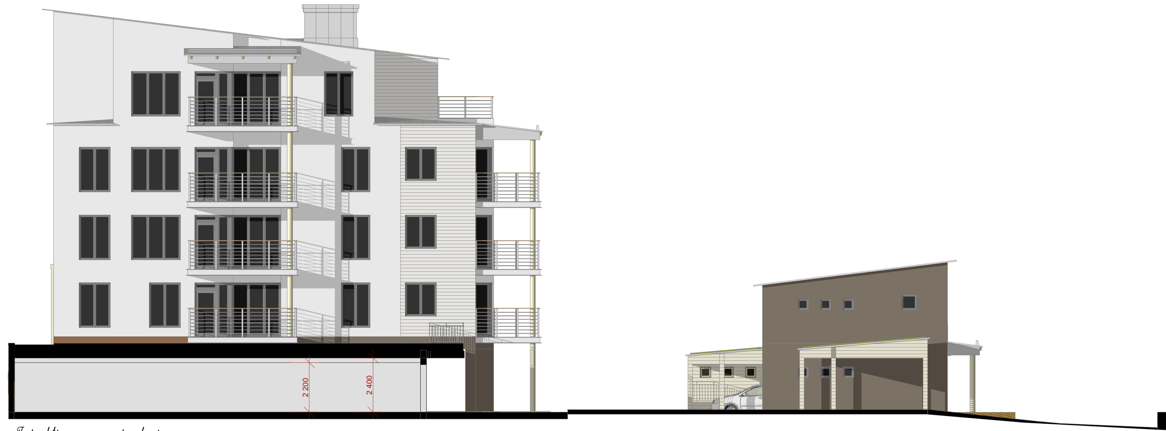
Typsektion genom parkeringsgarage