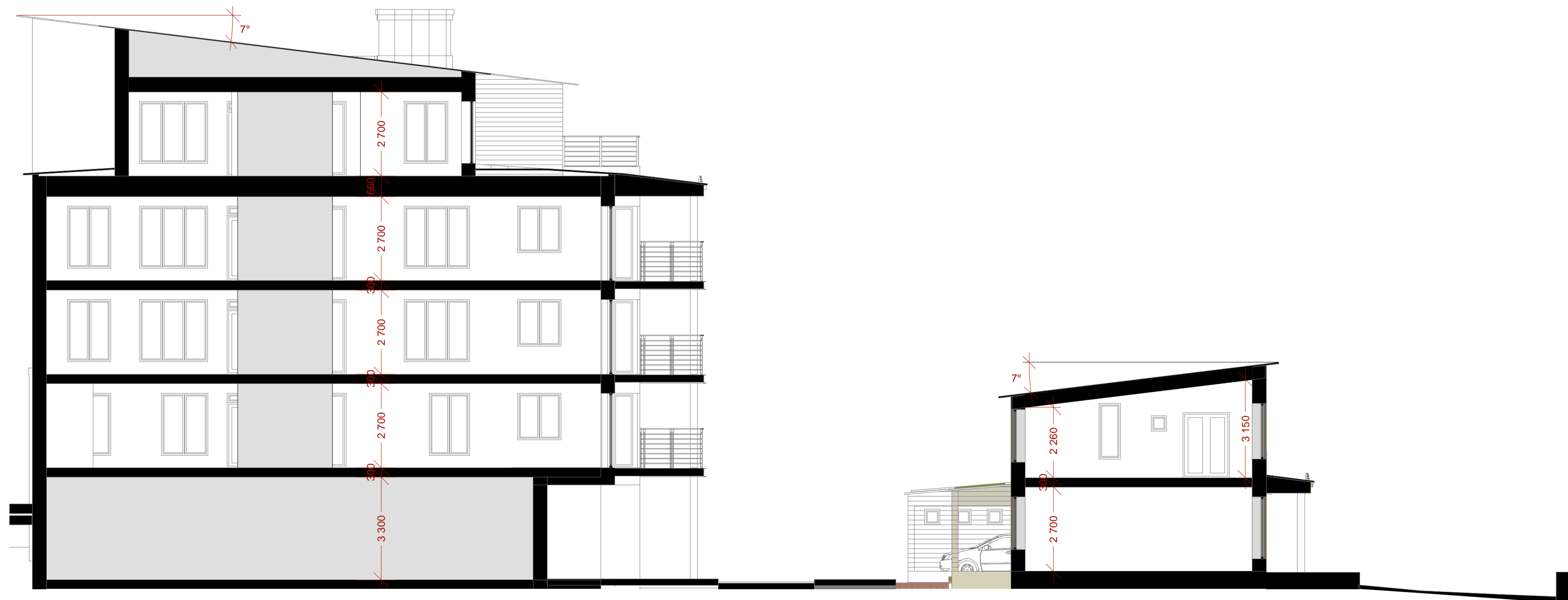
Typsektion genom bostadshus